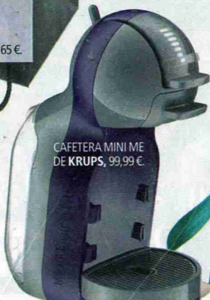
CAFETERA MINI ME DE KRUPS, 99,99 €.