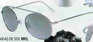
GAFAS DE SOL MO, DESDE 49 €.