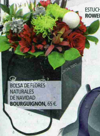
BOLSA DE FLORES NATURALES DE NAVIDAD BOURGUIGNON, 65 €.