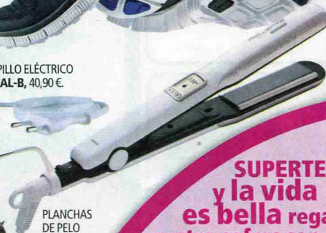
PLANCHAS DE PELO ROWENTA, 69,99 €.