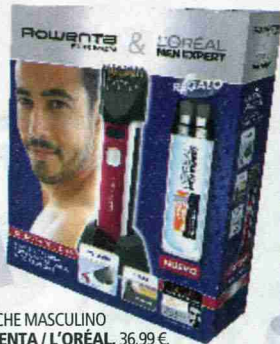
ESTUCHE MASCULINO ROWENTA / L'ORÉAL, 36,99 €.