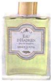
EAU D'HADRIEN EN ESTUCHE, DE ANNICK GOUTAL, 70 €.