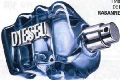
FRAGANCIA ONLY THE BRAVE, DE DIESEL, 55 €.