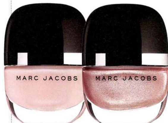
Esmaltes colección Enamored (c.p.v.) de Marc Jacobs Beauty.

Estás casi al final de tu puesta a punto, pero faltan los últimos detalles. Para el día de antes, en el centro Le Petit Salon, en su carta de tratamientos para novias, realizan un diseño de cejas para que tus ojos queden perfectamente enmarcados y ningún pelito fuera de lugar. A continuación, realizarán una manicura y pedicura con peeling incluido y un proceso intensivo de nutrición (mascarilla antienvjecimiento, ultrahidratante o baño de parafina, tú eliges). Para finalizar, te aplicarán el tratamiento Facial Diamond de Natura Bissé. Se trata de un estudiado protocolo facial a base de sueros biológicos y mascarillas de colágeno que proporcionarán a tu piel una luminosidad inmediata. (c.p.v.) www.lepetitsalon.es